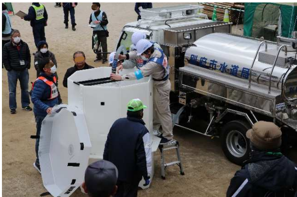
簡易水槽設置・給水