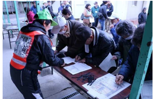
被災者班(避難者受付)