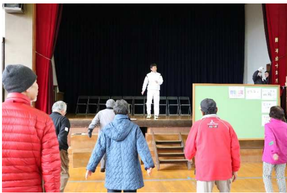
健康運動指導ボランティア派遣