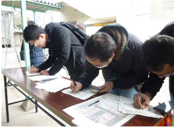
外国人避難者到着