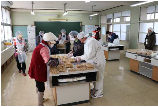
食料物資班(炊き出し)