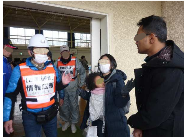
災害多言語支援センター派遣