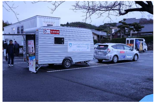
軽量トレーラーキャビン(医療的ケア仕様)