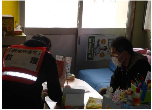
救護班(体調不良者対応)