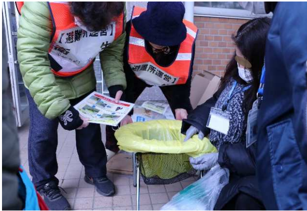
衛生班(簡易トイレ設置)