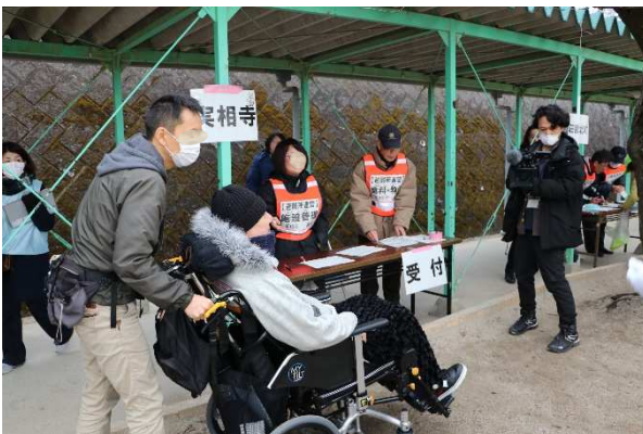
医療的ケアが必要な車椅子ユーザー到着