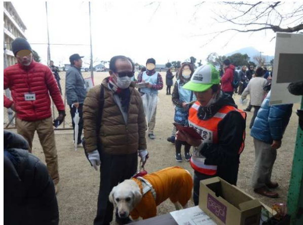
盲導犬ユーザー到着