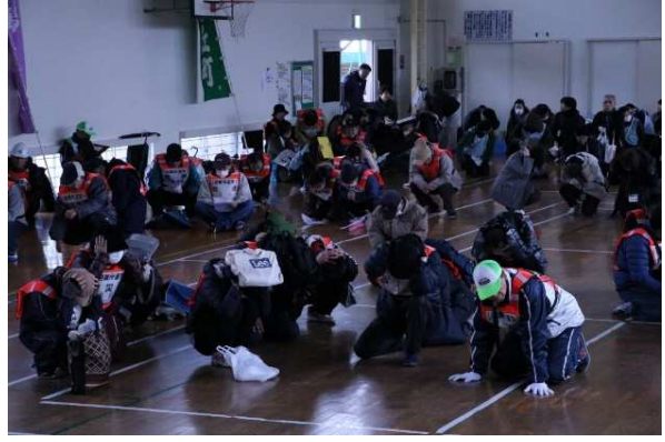
地震発生(シェイクアウト)