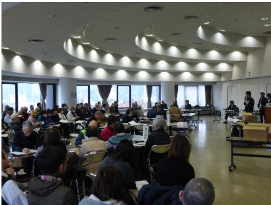
訓練前協議(全体協議)