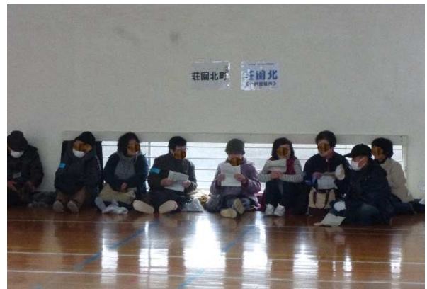
体育館内の避難者