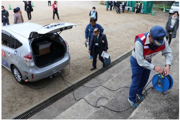
電源車(茨城県境町より参加)