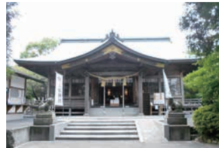
吉弘統幸を祀る吉弘神社