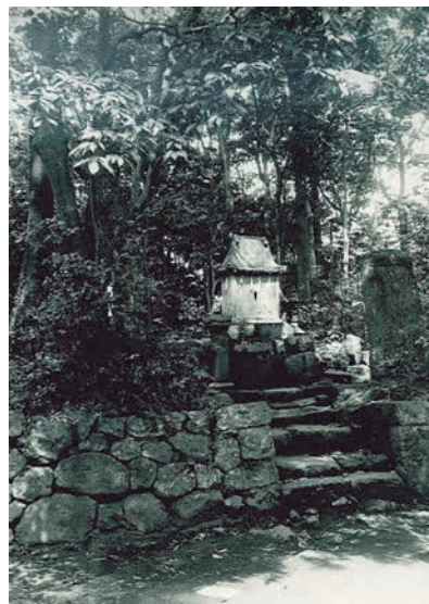
吉弘統幸墓（昭和四十五年頃）