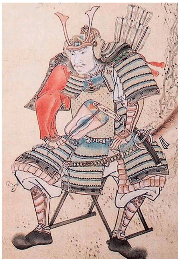
吉弘統幸（宝泉寺蔵）