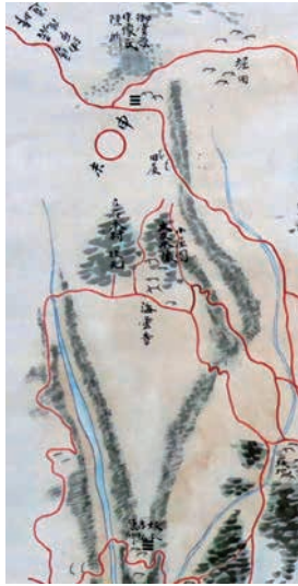
◀大友方陣所付近の拡大図

『石垣原合戦絵図』は、江戸時代に描かれた古戦場図で、右下には黒田・松井勢が布陣した実相寺山・加来殿山が描かれている。左側には大友勢が布陣した立石の陣が描かれ、「坂本吉弘陣所」「小屋園大友本陣」「御堂原宗像氏陣所」と記載がある。