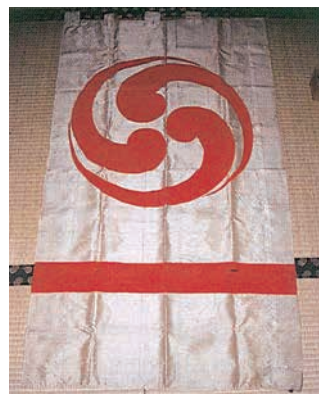
吉弘統幸が合戦の際に用いたと伝えられる旗指物（八幡朝見神社蔵）