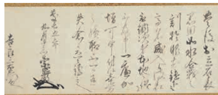
▲大友宗巖（義統）書状（吉良三右衛門宛） 慶長5年（1600）9月13日 福岡市立博物館蔵

この書状は、石垣原にて激しい戦いが行われた慶長5年9月13日に大友義統が吉良三右衛門宛に宛てた書状で、合戦の際の活躍を讃え、後に恩賞を与える旨を書きとめている。