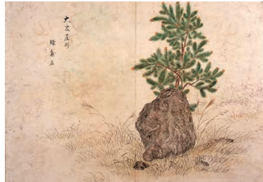
「大友屋形腰懸石」『鶴見七湯廻記』(大分県立歴史博物館蔵)