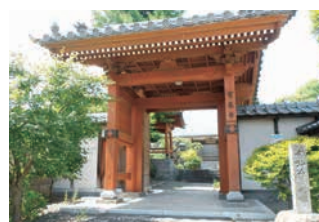
吉弘統幸の菩提寺宝泉寺