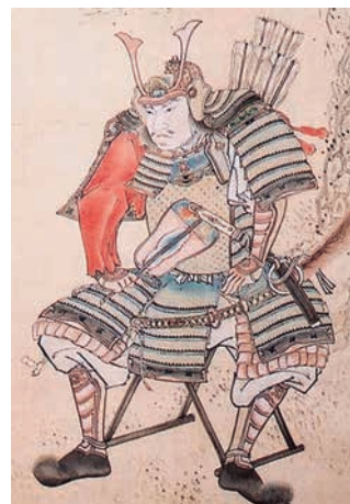
吉弘統幸（宝泉寺蔵）

※『黒田家譜』では、大友家の豊後除国後、吉弘統幸は一時期黒田如水に招かれ、井上九郎右衛門の領地に逗留していたと伝えている。