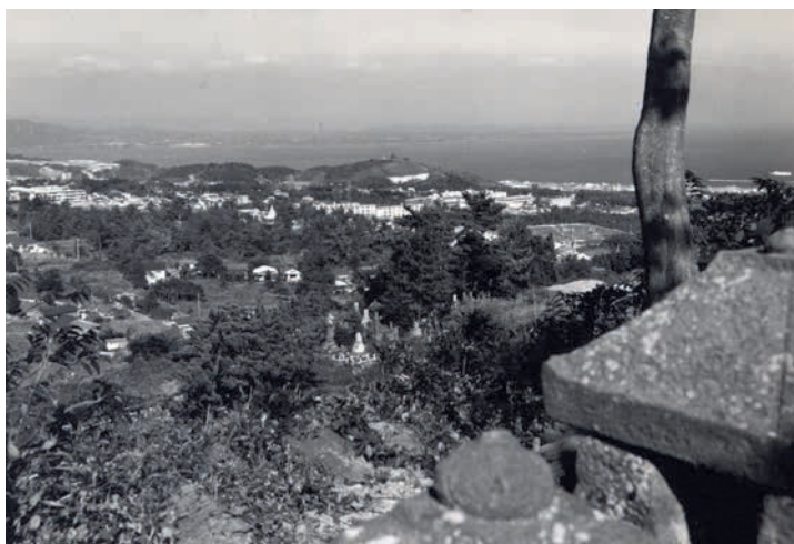
宗像掃部陣所跡付近から実相寺山を望む