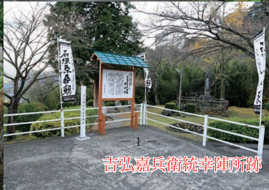
吉弘嘉兵衛統幸陣所跡