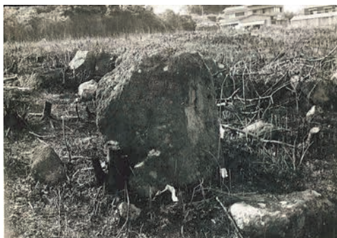
大友屋形石（昭和45年頃） 『鶴見七湯廻記』にも描かれていた（15頁参照）