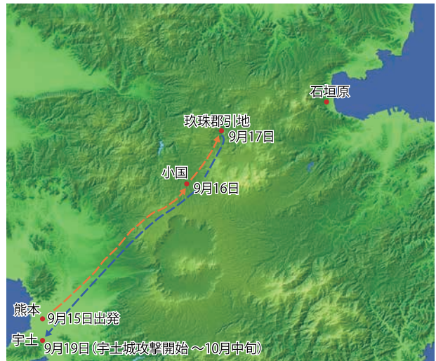
加藤清正の進軍ルート

9月17日付の書状では、玖珠郡引地村まで進軍し(④)、そこで合戦の勝利を知り、立石(石垣原)まで行って黒田如水などに会いたいが、肥後における毛利・石田方の宇土城(小西行长居城)攻めを行うため帰国する旨を伝えている(⑤)。