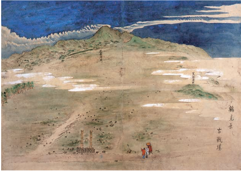
「鶴見原古戦場」『鶴見七湯廻記』(大分県立歴史博物館蔵)