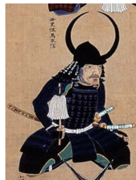
母里太兵衛 (福岡市博物館蔵)