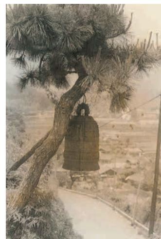
宗像掃部陣所跡から堀田温泉へと向かう 道端にあった「鐘掛の松」（昭和四十五年頃）