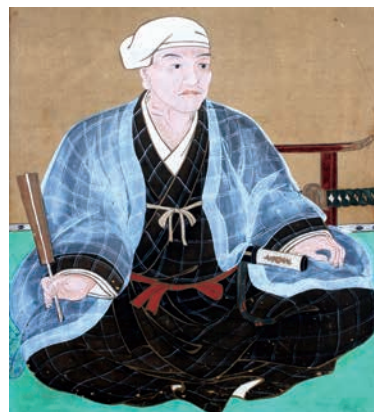
黒田如水（大分県立歴史博物館）

木付城に向かった先遣隊は木付城に着くが、すでに大友勢は撤退しており、戦う敵を失った黒田勢の先遣隊は大友義統が本陣を敷く立石に向かって進軍、13日に石垣原で激しい合戦が行われた。如水は13日の合戦の勝利を頭成（日出町）にて聞き、夕方すぎ実相寺山頂に布陣した。14日には実相寺山にて首実検を行い、15日には大友義統が降伏し、石垣原合戦は終結する。16日には熊谷直盛の安岐城を包囲し、その後、九州における毛利・石田方の諸城を攻略していった。