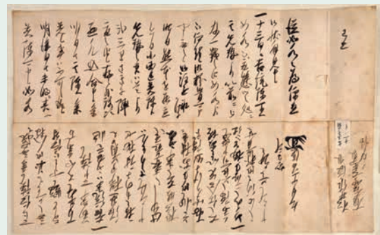
▲9月16日付 加藤清正書状