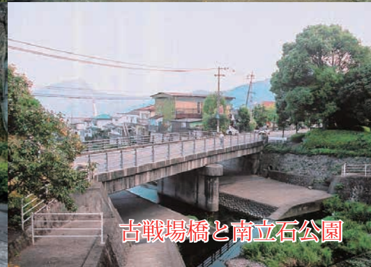
古戰場橋と南立石公園