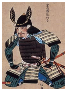
栗山四郎右衛門

黒田如水とともに中津城から出陣した武将は、栗山四郎右衛門・母里太兵衛・井上九郎右衛門・黒田凶書助ら後に黒田八虎と呼ばれる大身の家臣たちである。黒田家の主力は長政について関ヶ原合戦に臨んだとされているが、重臣の多くは如水とともに出陣し、石垣原合戦の際には実相寺山周辺に布陣した。