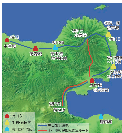
『黒田家譜』に記された黒田軍の進軍ルート