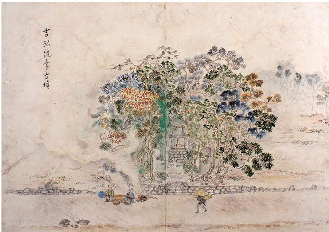
「吉弘統幸古墳」『鶴見七湯廻記』（大分県立歴史博物館蔵）