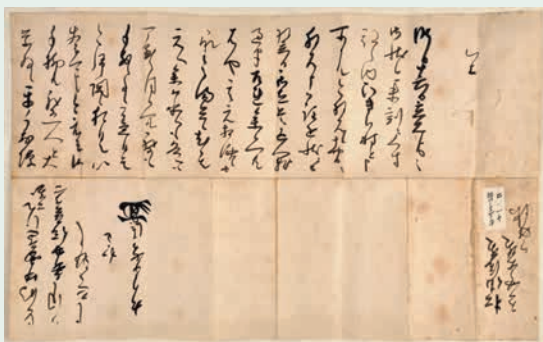
▲9月17日付 加藤清正書状

一十三日二、吉統陳所へ 如水被取懸候之処二、 其先勢より以前二被 及一戦之由、如水々 被仰越候、御粉骨可申 やう無之候、御注進承かけに、 ① 昨日熊本を罷立、 今日、小国迄着陳候、 ② 先勢之者ハ、是より 式三里さきに陣 取之由候、(中略) ③ 一吉統事ハ不及是非、 紹忍・掃部首を者 我々ものに討捕せ 申度候、さりとしてハ、 此中之表裏、重々之 誓昏在之事、不及 是非候、(中略) 加主計 九月十六日 清正 (花押) 松井佐渡殿 有吉四良右衛門殿