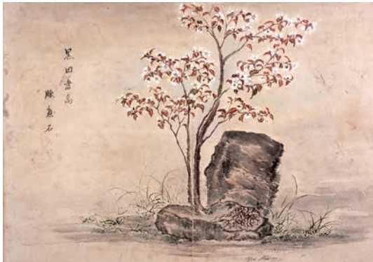
「黒田孝高腰懸石」『鶴見七湯廻記』(大分県立歴史博物館蔵)