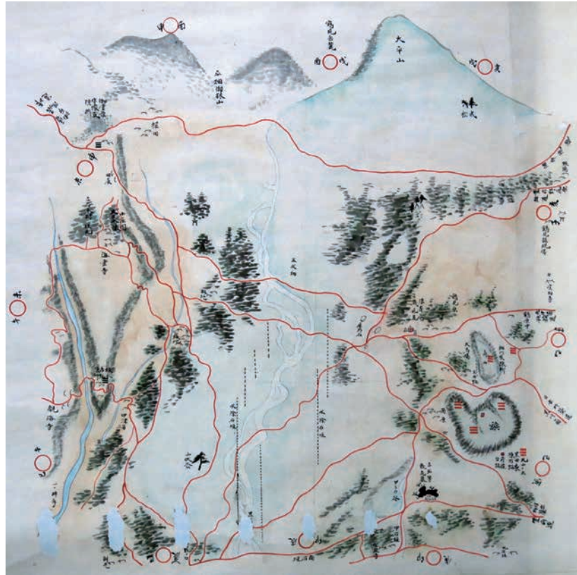
▲石垣原合戦絵図 江戸時代 大分大学学術情報拠点蔵

『石垣原合戦絵図』は、江戸時代に描かれた古戦場図で、右下には黒田・松井勢が布陣した実相寺山・加来殿山が描かれている。左側には大友勢が布陣した立石の陣が描かれ、「坂本吉弘陣所」「小屋園大友本陣」「御堂原宗像氏陣所」と記載がある。