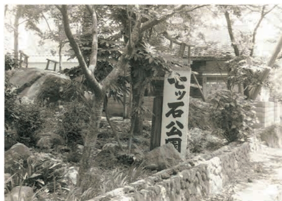
七ツ石（昭和四十五年頃）