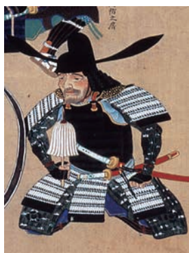
井上九郎右衛門 （福岡市博物館蔵）