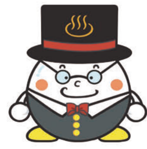
別府市健康づくり計画 「湯のまち別府健康21」 推進キャラクター「温たま」

〈実施方法〉 指定医療機関での接種 〈費用〉 無料 ※予防接種予診票は予防接種指定医療機関(P32)にあります。 ※別府市予防接種指定医療機関以外での接種を希望される方は、ご相談ください。