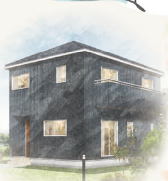
※イラストはイメージです。