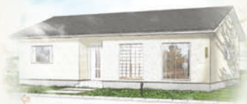
※イラストはイメージです。