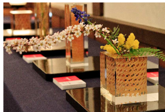
別府竹製品新製品開発事業