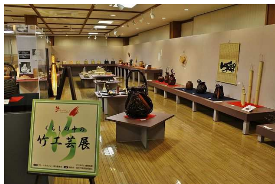
くらしの中の竹工芸展