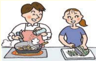
食事のしたくはだれがしますか？