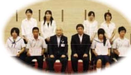
男女共同参画標語・川柳表彰式