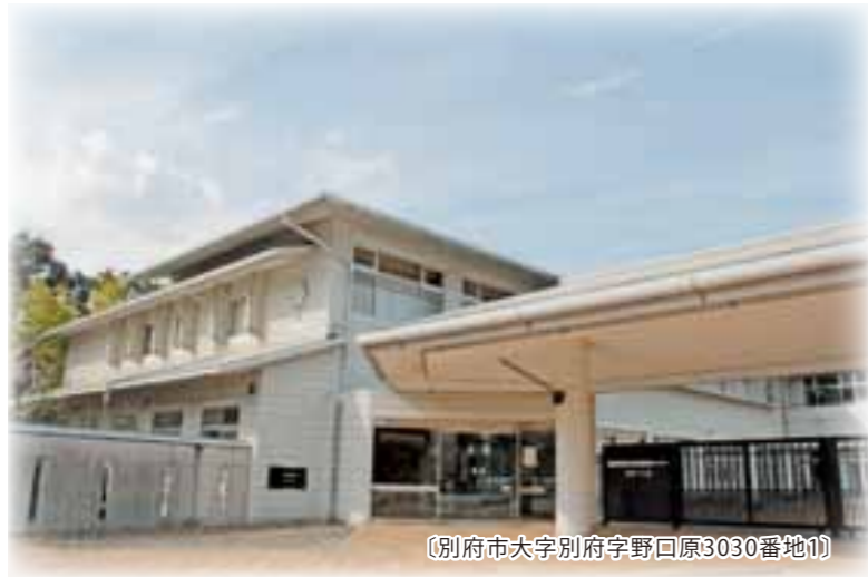
(別府市大字別府字野原3030番地1)

男女共同参画センター「あす・べっぷ」は、性別による格差のない、男女がともに生きやすい社会を目指し、基本として、次の4つの機能を持つセンターです。