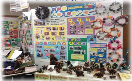
今年の別府ブース

センター事業の紹介や、春木っ子学習室の子どもたちが作ったクリスマスツリーやリースや動物を展示しました。