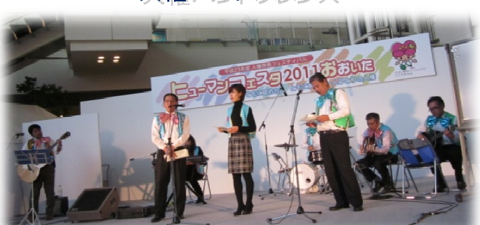
人権バンドフレンズ

県下隣保館職員・県庁職員・教職員で構成されたメンバーで、「人権」・「絆」につながる曲を8曲演奏しました。あたたかい雰囲気の中、音楽を通じて人権の尊さについてのメッセージを送りました。