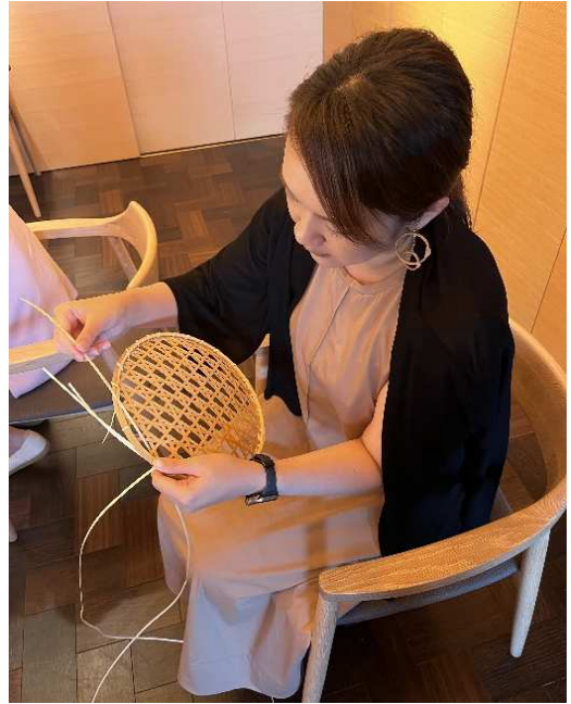
編み編み巻き巻き… (無)