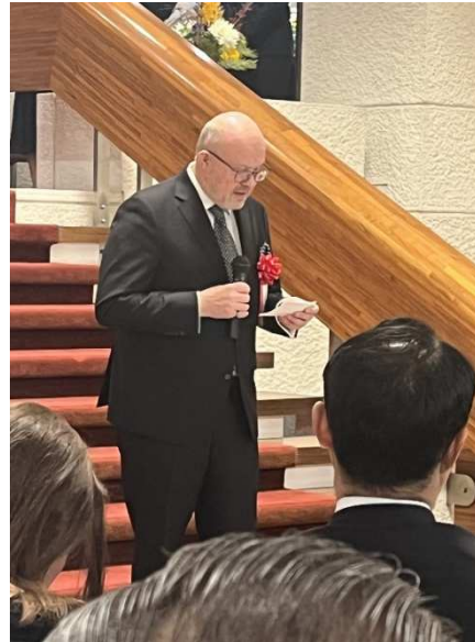
マルチン・クルチャル大使（左）、ヴラスチミル・ヴァーレク副首相兼保健相（右）のご挨拶