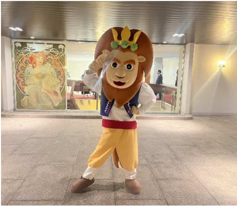
チェコ政府観光局日本支局の 公式マスコットキャラクター 『レフ丸』がお出迎え

令和5年10月31日(火)、渋谷区広尾にあるチェコ共和国大使館にて開催されたチェコ共和国建国記念日大使館レセプションに市長代理で東京事務所長が参加しました。