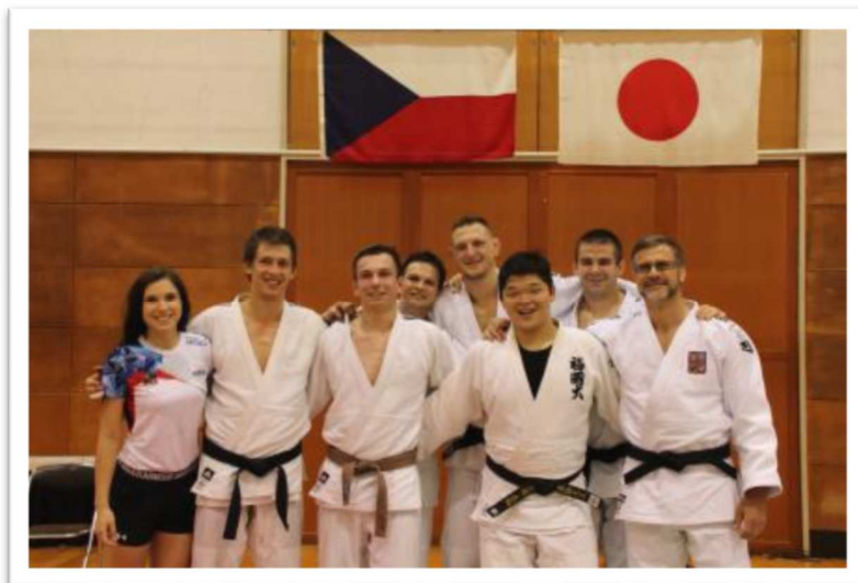
2019年柔道合宿の様子

別府市はチェコ共和国柔道選手の東京オリンピック事前合宿の受入などを行っており、友好関係を築いています。