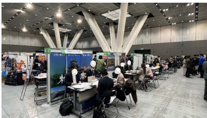
全国のコンベンション団体がブースを出展していました

別府市のブースには国内・海外の MICE 開催を検討する社・団体が商談や情報交換に訪れました。