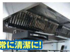
厨房設備は常に清潔に!

清掃、必要な点検及び整備など厨房設備の維持管理は「火災予防条例」で義務づけられています。