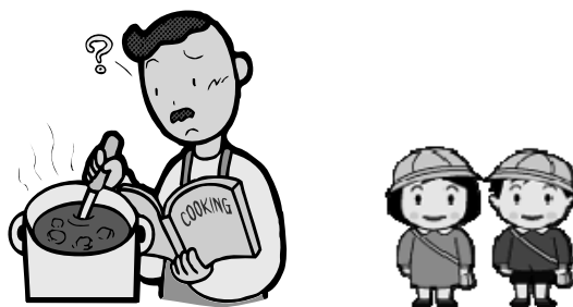
▼別府市の家族類型別世帯数（単位：世帯、人）（別府市統計書より）